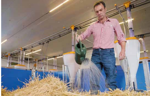
Das revolutionäre Strohstallkonzept